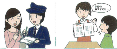
不当な差別的取扱いと合理的配慮の不提供が禁止されました

以上、平成27年度および平成28年4月から8月までにご寄付をいただいた皆様方を一部ご紹介させていただきました。なお、ご寄付の受付につきましては、法人本部および各事業部にて行っております。どうぞお気軽にお申し付けください。 今後とも社会福祉法人いたるセンターに変わらぬご協力ご支援のほど、よろしくお願ひ申し上げます。