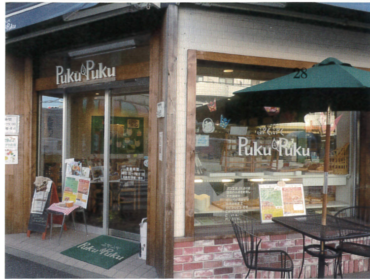
環八通り・荻窪二丁目交差点の角にある「パン工房プクプク」

9年6月20日にご利用者様が7人からオープンし7年が経ちました。当時は初めての経験が多かったため失敗もあり、お客様にご迷惑をかけたことを覚えております。同年10月には外販部門が立ち上がり、杉並区の児童館・区役所を皮切りに、現在、定期販売は41箇所、臨時販売は各種イベントなど50箇所もの会場で行っております。また、10年4月からは区内保育室・幼稚園等の給食にパンの提供を始め、現在22箇所の各事業所に納品しております。納品先でも残食をしなくなつたと大変好評を得ており、乳幼児の皆様にも安全・安心・無添加の製品を提供し続けていくことは大きな自信につながっております。振り返ると、東日本大震災時の原料入手困難、パン原料や化石燃料高騰による包材の急騰、消費税の導入・税率変更など何度か困難に直面しましたが、ここまで成長を遂げたのもひとえにご利用者様およ