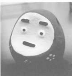
だるまの自主生産品が人気です!