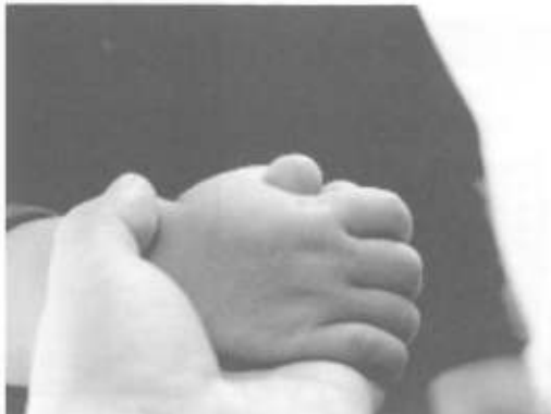
看護師の手あての様子

能となりました。また、G・H・C Hでの課題の一つである入居者全体の高齢化への支援対策にも講じてまいります。高齢化に伴う疾病や合併症予防への取り組みも看護師が常驻することにより、いま私たちが取り組んでいる知的・精神障害分野の支援をより一層医療的分野においても充実いたします。今後のG・H・C H事業部においてはこれらの新しい取組みを糧として今