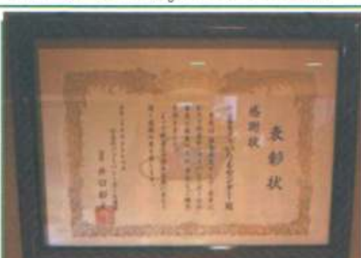
杉並区ソフトバレーボール連盟より感謝状

いたる広報委員 発行責任者=谷山 哲浩 社会福祉法人いたるセンター 〒167-0032 東京都杉並区天沼1-15-18 TEL: 03-3392-7346 FAX: 03-3391-8039 Eメール: info@itarucenter.com HP: http://www.itarucenter.com/ 発行日/平成25年7月1日 ご意見・ご感想がございましたら、上記のFAX、Eメール等でお声をお寄せ下さい。 いたる広報委員まで。