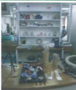
自主生産品カウンター

「視点」と「選択」 中、日々の支援が積み重なっていくということは、「人間関係も含めた安心できる環境ができる」という良い点と、「馴れた人間関係」が形成されていくという危険性の抱き合わせです。「普通にみておかしなことはおかしい」ということを職員に伝えていくという事は非常に大切なことだと考えております。 ふたつ目は「選択性」です。飲み物を買う・食事を注文する・読みたい本を選ぶ・やりたい仕事を選ぶ;等、私たちの日々の生活は「選択」の連続です。利用者様を取り巻く環境が「措置から契約」へと変わり、「選ぶ自由」が保証されている今、もっと積極的に「選べる」機会を提供し、「選ぶ」ことの楽しさや難し