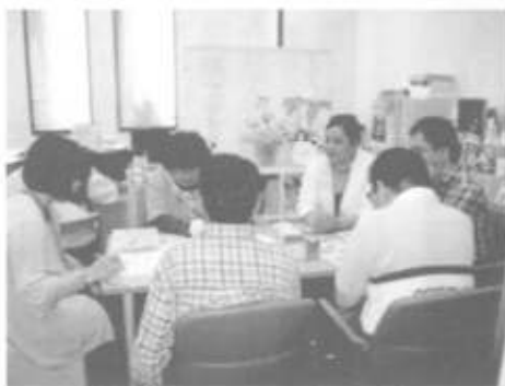
茶話会のメニュー決めの様子

さらに、高井戸エリアの区民の方に向け、5月に発達障害の基礎講座を開催し、今後継続して開催していく予定です。すまいる高井戸では、こうした活動に興味をお持ちのボランティアの皆様も募集しています。