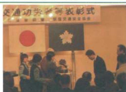
荻窪警察署での表彰の様子